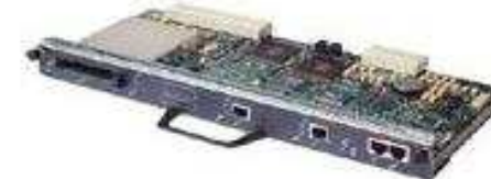
UBR7200-I/O-2FE/E kontrolerska kartica

I/O kontroler se montira u posebno za njega predviđen slot na ruteru.